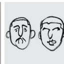
Dainippou Type Organization