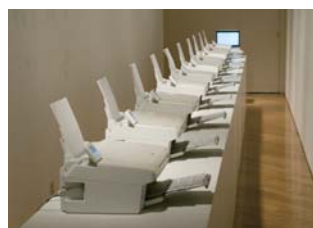
稲葉英樹「PRINTER」 Installation, 2010 Courtesy of the Artist

アートディレクター・佐藤直樹が率 いる「ASYL」からは、佐藤直樹みず からと、特徴的なタイポグラフィ作 品が注目を集めるデザイナー・大原 大次郎が共作を出展。