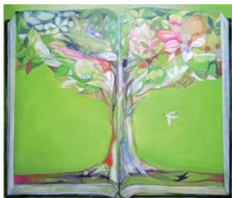
大谷有花「黒い本ー創造の木ー」 Painting, 2009