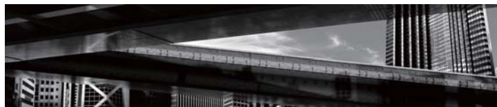
緒方範人「Extraordinary Machine#5」 Photography print, 2010

クリエイティブディレクター・後藤繁雄が率いる「g 3 / gallery」からは、 「異物」や「トランスミッション」、「変換」をイシューとして捉える若手 アーティストとして選出した4名が出展。