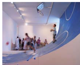
伊藤ガビン「Zero GravitySports」(過去作品例) Installation, 2001