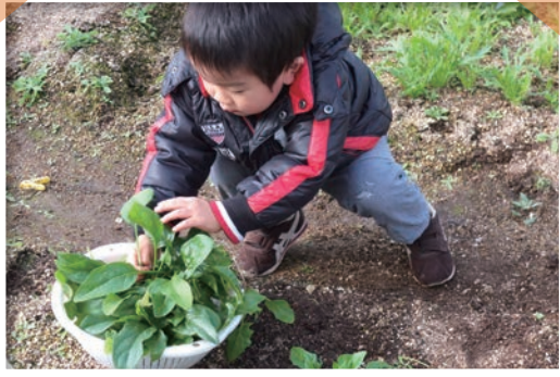
たくさんとれたね！