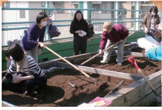
最初は土から耕します