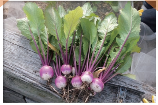
育てられる野菜はいろいろ