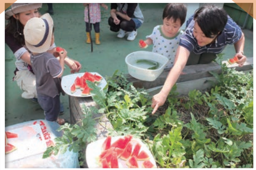
穫れたての野菜を試食！