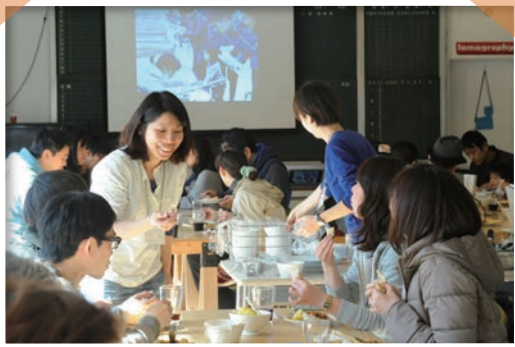
年2回行われる収穫祭