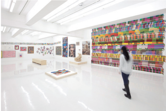
第1回目の公募展 展示風景