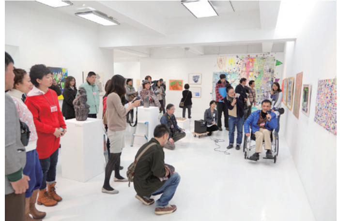
第2回目の公募展 トークイベントの様子

拝啓 初冬の候、皆様方におかれましてはますますご清祥のこととお慶び申し上げます。 この度、アーツ千代田 3331 では、2012年12月14日（金）より障がいのある人×ない人×アーティストによるアート作品の全国公募展「ポコラート全国公募展 vol.3 アール・ブリュット？ アウトサイダー・アート？ ポコラート！福祉 × 表現 × 美術 × 魂」を下記のとおり開催致します。つきましては、より多くの方にご来場頂きたく、ぜひとも広く周知・告知活動にご協力賜りますようお願い致します。