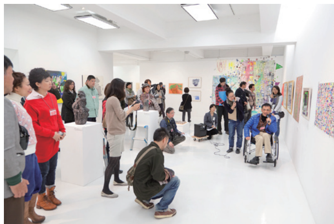
第2回目の公募展 トークイベントの様子

拝啓 初冬の候、皆様方におかれましてはますますご清祥のこととお慶び申し上げます。 この度、アーツ千代田 3331 では、2012年12月14日（金）より障がいのある人×ない人×アーティストによるアート作品の全国公募展「ポコラート全国公募展 vol.3 アール・ブリュット？ アウトサイダー・アート？ ポコラート！福祉 × 表現 × 美術 × 魂」を下記のとおり開催致します。つきましては、より多くの方にご来場頂きたく、ぜひとも広く周知・告知活動にご協力賜りますようお願い致します。