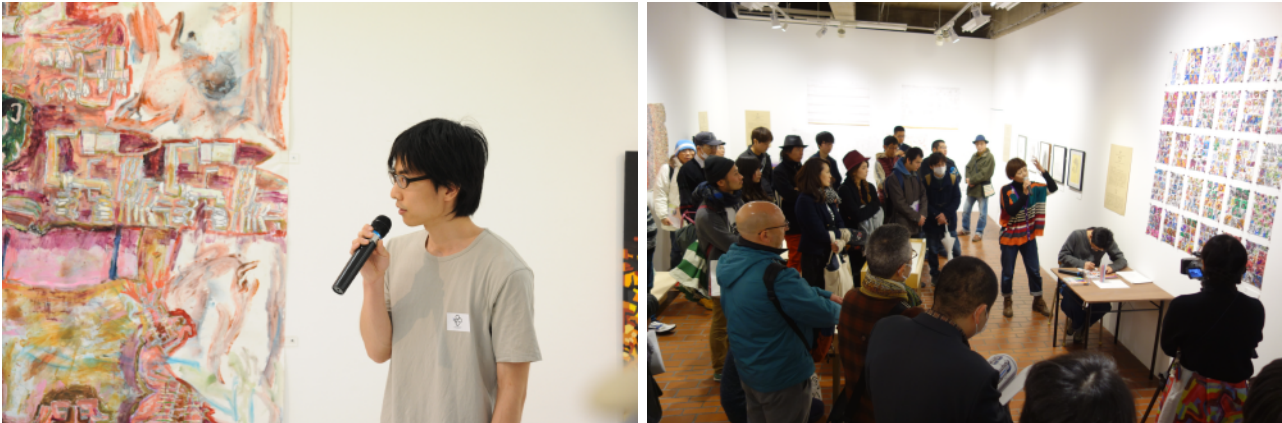
(左(右) ポコラート全国公募 vol.6 受賞者展 アーティストトークの様子

ポコラート全国公募 vol.7 の受賞者 8 名やその支援者が受賞作品についてのエピソードを直接紹介し、スタッフのコメントを交えながら会場内をまわるイベントです。作者たちの作品に込めた思いや、制作する上での独自の視点は、参加者の視野を広げるきっかけになることでしょう。