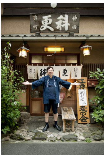
堀井市朗／神田錦町 更科そば 2012年