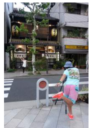
撮影風景 2013年