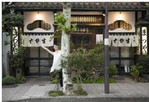
小高愛花／神田まつや 2013年