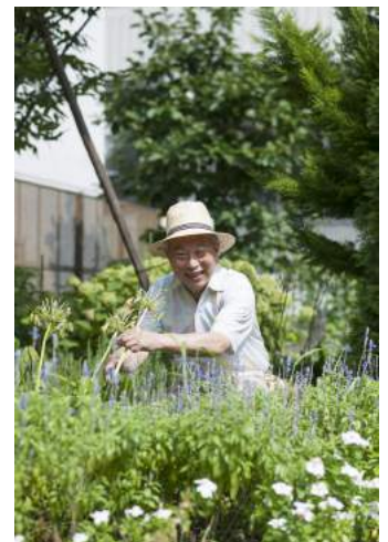
石田勝彦／練成公園 2013年