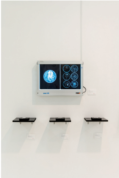
平野真美《変身物語 METAMORPHOSES》 3331 ART FAIR 2020 展示風景

平野真美の作品は、いつも死と向き合い抗うことで、我々が今をいかに生きるのかを指し示してきた。