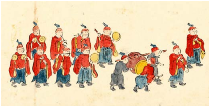
浦島太郎の物語の行列には、頭に魚の被り物が愛らしく乗っている↑