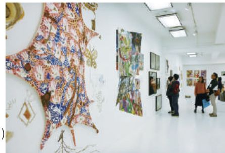
1F メインギャラリーエリア イメージ (2017 年開催時)