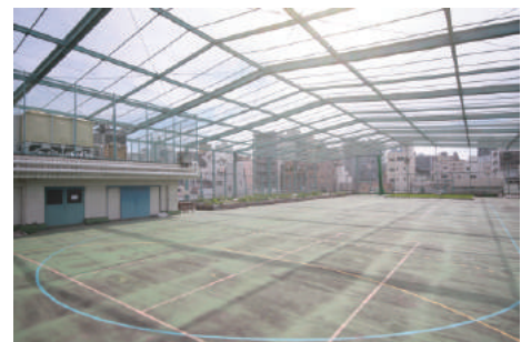
アーツ千代田 3331 屋上 (元校庭)