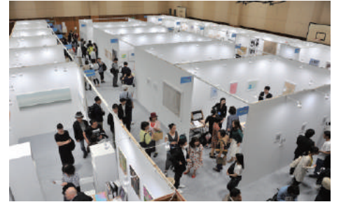
2F 体育館エリア イメージ (2017年開催時)

コバヤシ画廊 (東京) トーキョーアーツアンドスペース [TOKAS] (東京) コウイチ・ファイン・アーツ (大阪) 愛知県立芸術大学 (愛知) 橋画廊 (東京) 秋田公立美術大学 (秋田) 104 ギャラリー (東京) アキバタマビ 21 (東京) アートトレイスギャラリー (東京) 桂園芸術大学 写真工房 李 (ソウル) aura gallery (北京) 東京藝術大学大学院中村研究室 (東京) CAI 現代芸術研究所 /CAI02 (北海道) 東北芸術工科大学 (山形) ギャラリー G (広島) 武蔵野美術大学 (東京) Gallery it (東京) アーツ千代田 3331 (東京) GALLERY 龍屋 (愛知) ギャラリーユキコカワセ (パリ) KANA KAWANISHI GALLERY (東京) ONJI TAE PROJECT (東京)