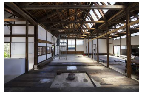
yamajorimono*works 《天井を張る》 2017年6月23日