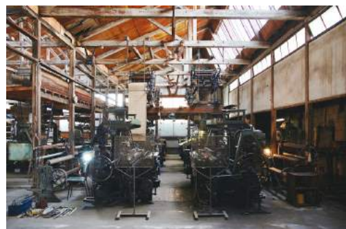
yamajorimono*works 《織機を鳴らす》2006年11月5日

yamajorimono*worksが桐生を離れた場所で、「個展」という形で公に公開されるのは本展が初めてとなります。長きに渡り継続しているこの作品の軌跡を、インスタレーションや映像、約2000枚もの写真資料を使用した作品で振り返っていただくことができる、今までにない特別な機会です。