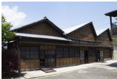
山治織物工場 2016年4月30日