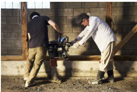
yamajorimono*works 《土間を打つ》 2014年5月31日