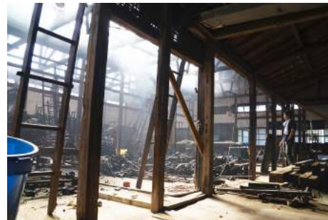
yamajorimono*works 《織機を分解する》 2007年6月23日