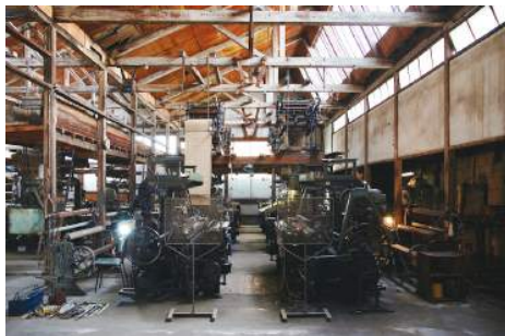
yamajorimono*works 《織機を鳴らす》 2006年11月5日